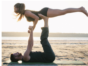
Klasse 2 - Flieger mit Händen