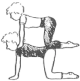
Klasse 3 - Bank auf Bank

Zwei Turner demonstrieren die ihrer Klasse entsprechende akrobatische Partnerübung ohne Hilfestellung seitens des Trainers. Die Übung soll 3 Sekunden lang gehalten werden. Die Partner können frei entscheiden, wer Unter- und Obermann ist. In einer vollständigen Mannschaft muss jedes Kind genau einmal an einer Partnerübung beteiligt sein. Bei unvollständigen Mannschaften darf bei ungerader Anzahl ein Kind aushelfen. Die restlichen Wertungen werden wie gehabt aufgefüllt (s.o.).